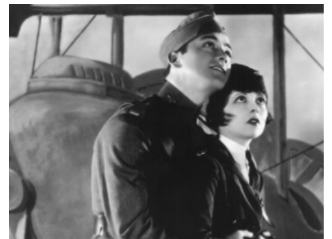
1927 LES AILES (The Wings) de William Wellman avec Charles Buddy Rogers