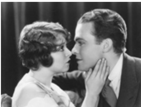
1930 LOVE AMONG THE MILLIONAIRES de Frank Tuttle avec Stanley Smith