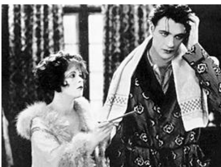
1927 LES ENFANTS DU DIVORCE (Children of Divorce) de Frank Lloyd avec Gary Cooper