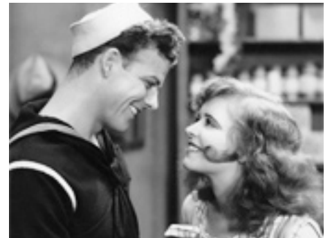
1930 TRUE TO THE NAVY de Frank Tuttle avec Rex Bell