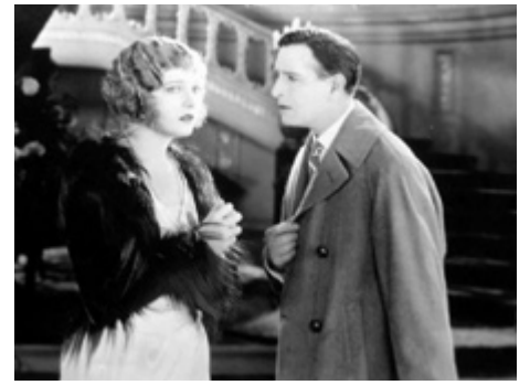
1923 LES TAUREAUX NOIRS (Black Oxen) de Frank Lloyd avec Alan Hale