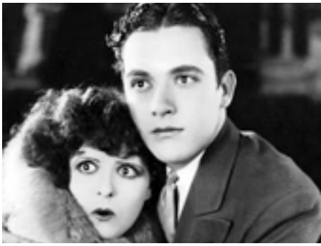
1928 IL FAUT QUE TU M'ÉPOUSES (Get Your Man) de Dorothy Arzner avec Charles Buddy Rogers