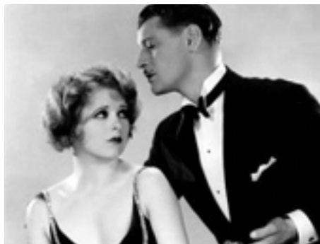
1930 SA NUIT DE NOCES (Her Wedding Night) de Frank Tuttle avec Ralph Forbes