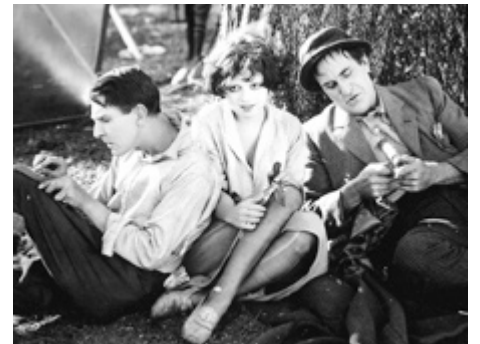
1926 MANTRAP (Mantrap) de Victor Fleming avec Percy Marmont, Ernest Torrence