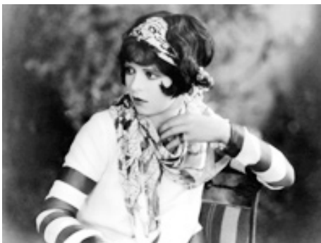
1926 KID BOOTS de Frank Tuttle