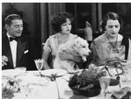
1927 HULA (Hula) de Victor Fleming avec Clive Brook, Arlette Marchal