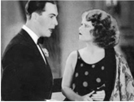
1928 L'AMOUR JOUE ET GAGNE (Three Weekends) de Clarence Badger avec Neil Hamilton