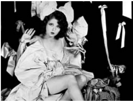
1922 BEYOND THE RAINBOW de William C. Cabanne