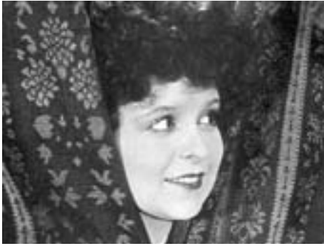
1925 LE PARADIS EMPOISONNÉ (Poisoned Paradise) de William Beaudine