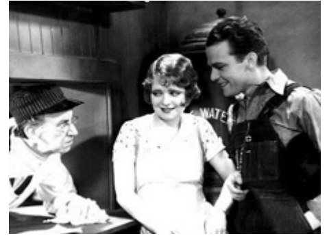
1926 LE FIANCÉ D'ÈVE (Eve's Lover) de Roy del Ruth avec Bert Lytell, Arthur Hoyt