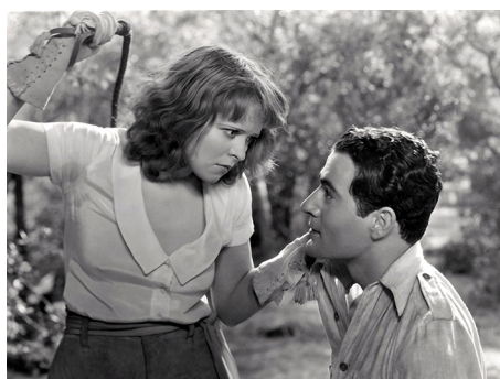
1932 FILLE DE FEU (Call her Savage) de Frank Lloyd avec Gilbert Roland