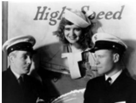
1930 PARAMOUNT ON PARADE de Clarence Badger, Edward Sutherland, Frank Lloyd