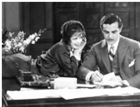
1927 LE COUP DE Foudre (It) de Clarence Badger avec Antonio Moreno