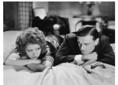
1931 SANS LIMITE (No Limit) de Frank Tuttle avec Ralph Forbes