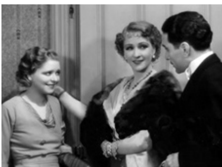
1931 KICK IN de Richard Wallace avec Juliette Compton