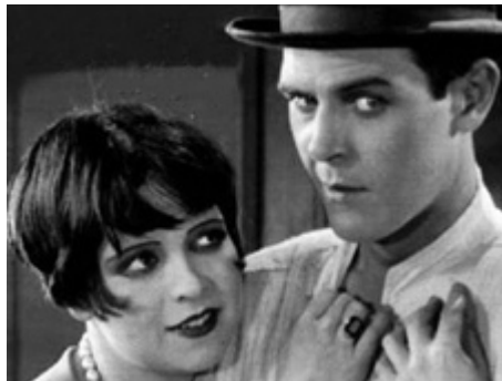
1925 THE PLASTIC AGE de Wesley Ruggles avec Donald Keith