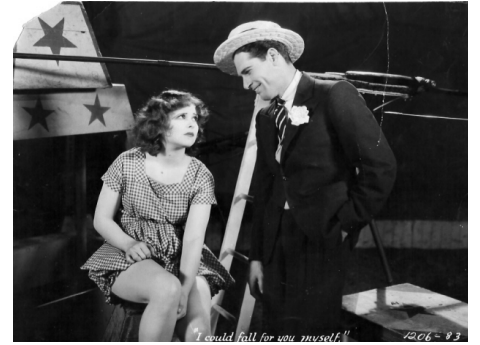
1929 LA DANSEUSE DE CORDE (Dangerous Curvers) de Lothar Mendes avec Richard Arlen