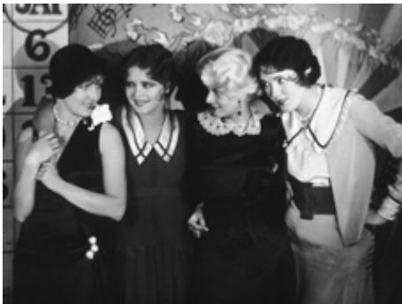
1929 LA CADETTE (The Saturday Night Kid) d'Edward Sutherland avec J. Harlow, J. Arthur, Edna M. Oliver