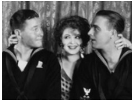
1928 QUAND LA FLOTTE ATTERRIT (The Fleet's in) de Malcom St. Clair avec Jack Oakie, James Hall