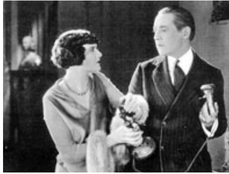
1926 PEINE CAPITALE (Capital Punishment) de James Hogan avec Elliot Dexter