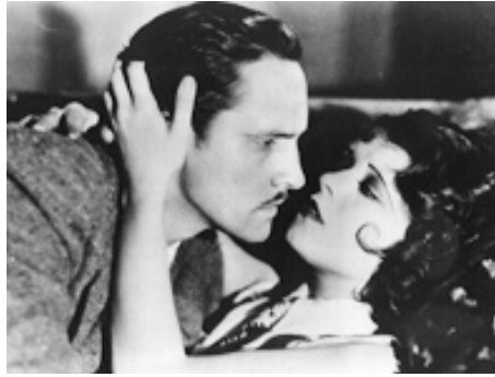
1929 LES ENDIABLÉES (The Wild Party) de Dorothy Arzner avec Fredric Marsh